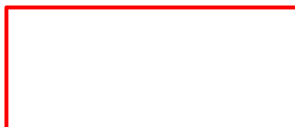
Рисунок 3. Вход в Приложение